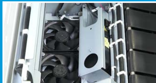
Espectrofotómetro en línea

ACQS es una potente combinación de un avanzado software de gestión del color y un hardware integrado que liberan al operador de las complejas decisiones de mantenimiento del color para trasladarlas a un sistema automatizado, eliminando así el tiempo y los errores asociados a una gestión manual del color. Una vez iniciado por el operador, ACQS automatiza los gráficos de impresión y medición de la calibración, y calcula ajustes precisos en tablas de color en función de los resultados.