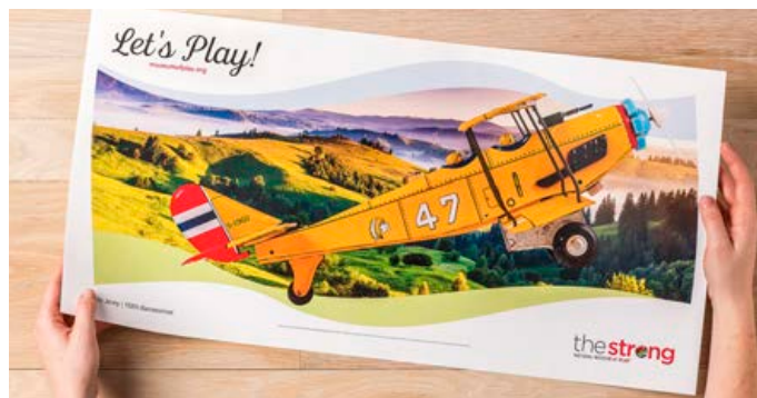
Impresión en formato largo, con un tamaño máximo de papel de 330 x 660 mm

Todo ello se traduce en unos mejores márgenes, unos mayores beneficios y la posibilidad de crecer estratégicamente con una única inversión de futuro.